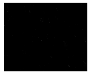
Insurance of things