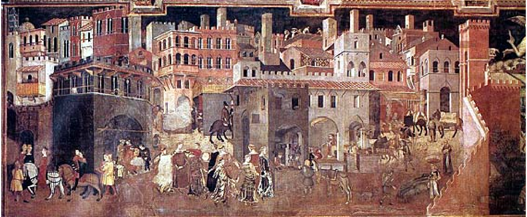
Ambrogio Lorenzetti, Effetti del Buon Governo in città , 1338-1340 Sala della Pace, Palazzo Pubblico, Siena